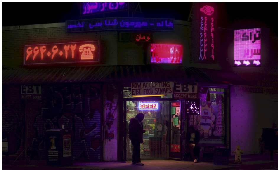
Visuel : City of Tales - Arash Nassiri

Exil/s est une programmation de films issus de la collection d'œuvres du Cnap et du FRAC Sud, proposée par Nicolas Feodoroff invité par Pascale Cassagnau du Centre national des arts plastiques, en écho à l'exposition qu'elle a curatée au Centre Photographique Marseille Dits et écrits dispersés - Exils passages et leurs récits . L'exposition se tient du 27 octobre au 25 novembre au CPM, dans le cadre de la Biennale de la Joliette et du Festival Photo Marseille.